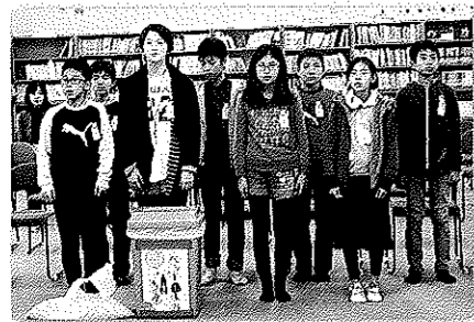
大住小ボランティア委員会の皆様

僕がボランティア活動でひとときわに残っているのは、なごみを訪問してお年寄りの方と交流したことです。