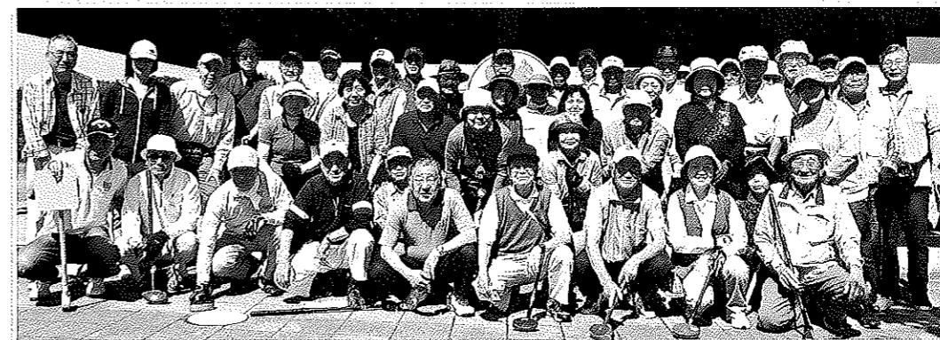
快晴の中でプレー