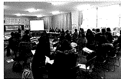
講話風景「えがおのたまご」