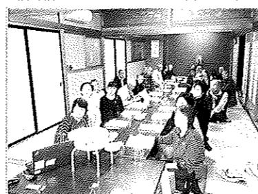
福祉協力員研修会（10月9日）