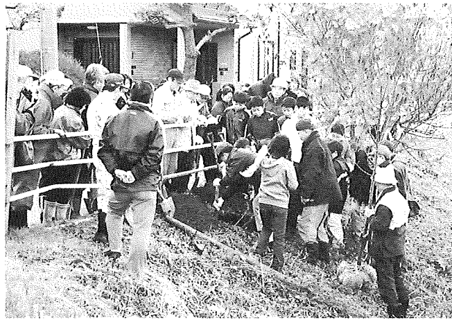
築山と牛島の子供達と大人が一緒に、太平川の堤防に桜の苗木を植えました。