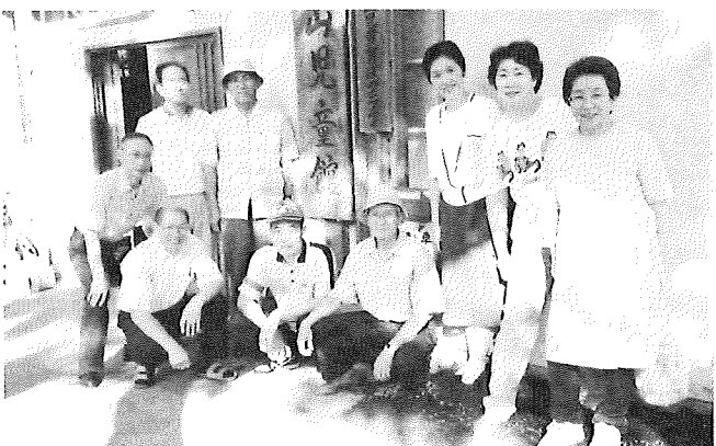
榎山児童館の引越しを終えて

の内容についてお話がありました。 また、参加者からは今後のこの集いに対する要望などをお聞かせいただきました。