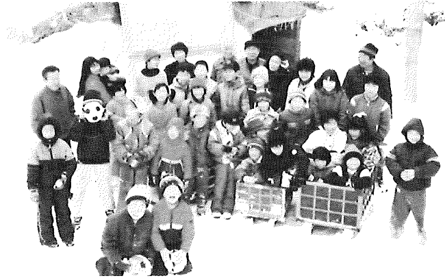
榎山かまくらに集まった築山の子ども達

の運動（筋トレ）になると話されておりました。 市民憲章では毎年秋に他団体と共催しながら、いろいろなテーマで講演会を開催しておりますので、ぜひ足を運んでみて下さい。