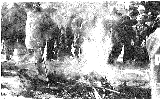
ドンド焼きの風景

単純な競技だが、子供達は雪玉を相手に当てる楽しさや快感があり、またやられたら「はらんべわり」となる。しかし試合となると、応援している子供も大人も大声を出して熱くなる。立派なスポーツである。