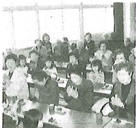
園児の発声で「いただきます！」