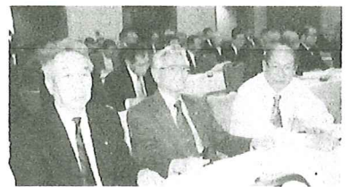
秋田市における総会風景