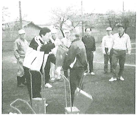
毎年行われる築山小学校の自転車教室へのお手伝い

「他人に迷惑をかけない」これがこの国で社会生活を送る上での基本である。突き詰めていくと、他人とは一切関わらないことが、最善の方策にすらなってしまう。一方「他の人のために自分のできることをする」これが欧米における社会生活の基本であり、ボラ