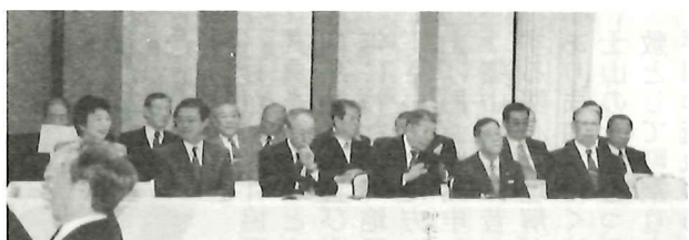
式典にご臨席いただいた来賓の皆様