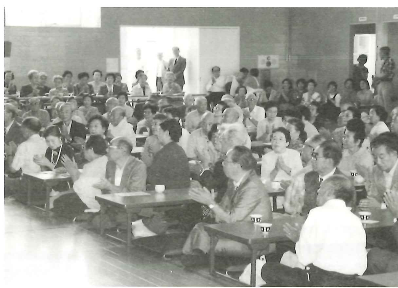
会長のあいさつに熱心に耳を傾ける出席者