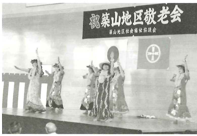
フラダンスで歓迎してくれたブルメリアの皆さん