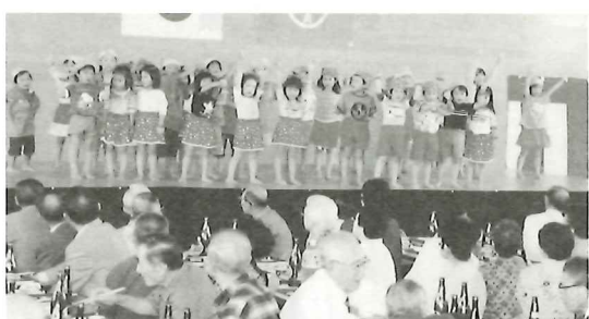
今年も元気に踊ってくれたみどり保育園児