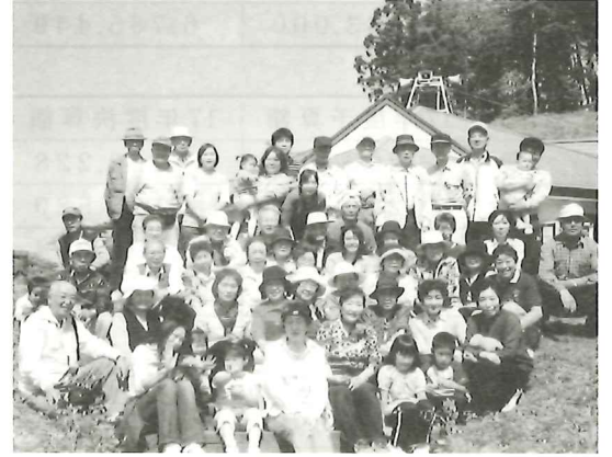
春のレクリエーション参加者