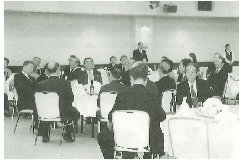
祝賀会のひとこま (上・右下)