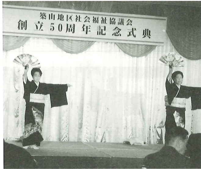
祝賀会に花を添えていただいた寿位峰会の皆様