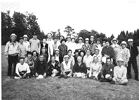
いきいきサロン……グランドゴルフで一汗

築山と牛島の住民が中心となり観桜会実行委員会を作り、多くの方々の善意に支えられ観桜会が実施されております。堤防へのゴミ捨てなどせず、すばらしい桜並木をみんなの手で育て見守つて行きたいものです。