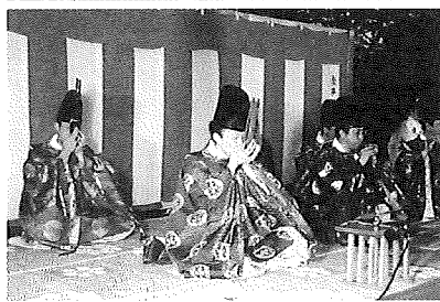
愛宕下橋から見た桜並木と雅楽の夕べ