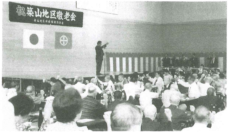
泉檜山交番所長の音頭で祝宴がスタート