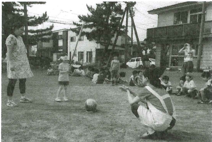
「スイカ割り」を楽しむ児童

きるのは、児童センターを支えてくださる運営委員会、地域の方々、小学校PTA保護者等、多くの皆様のご協力のおかげと、心より感謝しております。築山児童センターが、仲間との出会い、ふれあいを通じて様々な経験をしながら、榎山つ子が健やかに安心して過ごせる場となるよう、これからも各位におかれましては、一層のお力添えをお願い申し上げます。