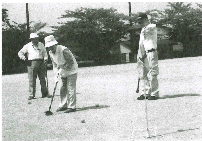
グラウンドゴルフ友の会

これは、特に高齢者の社会参加・交流を促すとともに、閉じ籠もりを防ぐ目的もあります。対象とする地域サロングループは別表のとおりです。 みなさん、お誘い合わせてエンジョイしましょう。連絡先は、それぞれの代表者やお仲間です。