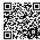
お申し込み用紙 ダウンロードQR