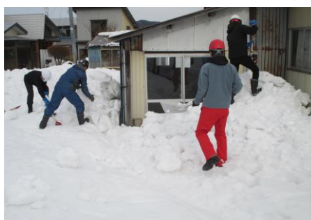
昨シーズンの活動風景