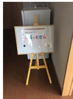
部屋の入口には案内板が