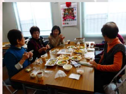
おしゃべりの時間