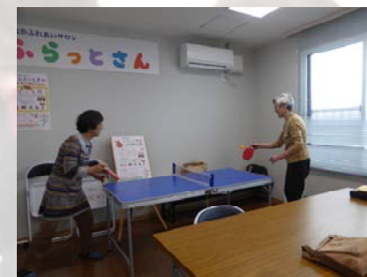
ピンポン卓球もできます