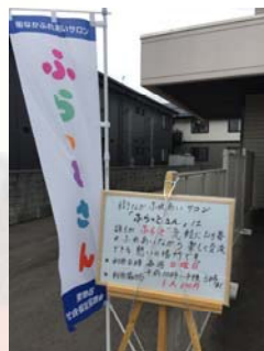
入口の“のぼり”が目印

地域でたくさんの人と出会い交流し、お話をしたり、仲間と悩みなどを共有することで、 支え合いの輪 を広げます。