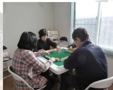
頭を使う健康マージャン