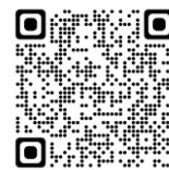
お申し込み用紙 ダウンロードQR