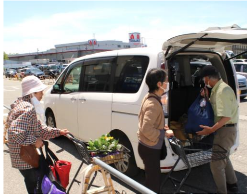
たくさん買い物をして皆さん満足した様子

「 車やめてからどこも行けなくなつたもんなあ。 」と話されたのは一人暮らしの女性でした。