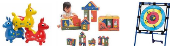
ロディー ミッフィー大きなブロック ターゲットゲーム